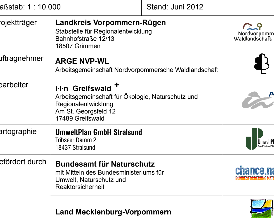
Karte 10.1 : Maßnahmen, geplante Nutzung (Kerngebiet/Untersuchungsgebiet)