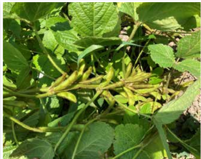
Abbildung 8: Sojapflanze

Sonnenblumen sind im Anbau weniger anspruchsvoll und es stehen, obwohl züchterisch weniger stark bearbeitet, einige Sorten für den Ökoanbau zur Verfügung. Die bisherigen Erfahrungen zeigen jedoch, dass die Abreife in Mecklenburg-Vorpommern im Herbst unsicher ist. Die feuchte Witterung begünstigt nach der Blüte den bedeutenden Pflanzenschädling Botrytis und erfordert fast immer eine Körnerdunkung. Bei Hanf und Hirse ist das Sortenangebot für unsere Region eingeschränkt. Hirse wird vor allem zur Verfütterung im eigenen Betrieb angebaut. Hier gibt es kaum ökologisches Saatgut. Bei Hanf stellen die strengen gesetzlichen Regularien sowie die Saatgutbeschaffung und -qualität eine Herausforderung dar.