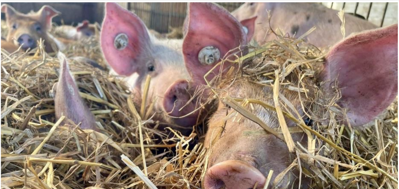
Abbildung 5: Haltungsstufe 5 in der Schweinemast

Auskunft erteilt das Staatliche Amt für Landwirtschaft und Umwelt Westmecklenburg.