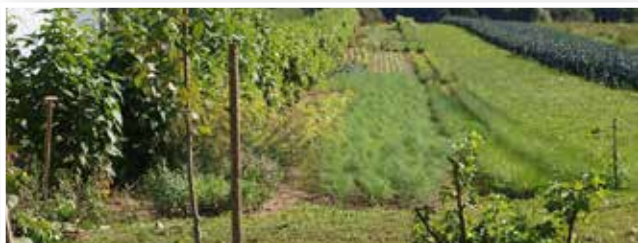
Abbildung 1: Gemüseanbau im ökologischen Landbau

Die Leistungen des ökologischen Landbaus werden derzeit nicht vollständig über den Markt abgegolten. Insbesondere gesellschaftlich erwünschte Zusatzleistungen wie der Gewässer- und Naturschutz müssen daher mit öffentlichen Mitteln vergütet werden. Der ökologische Landbau soll die nachhaltige Entwicklung der Landwirtschaft vorantreiben und den bewussten Umgang mit den natürlichen Ressourcen in der Landwirtschaft fördern.