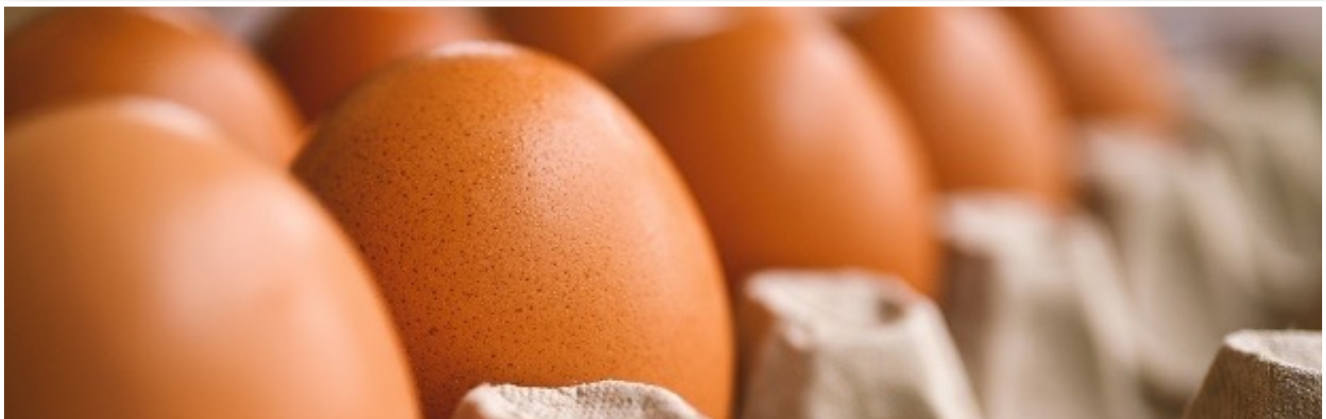
Abbildung 4: Eierabpackung

Auskunft erteilt das Staatliche Amt für Landwirtschaft und Umwelt Westmecklenburg.