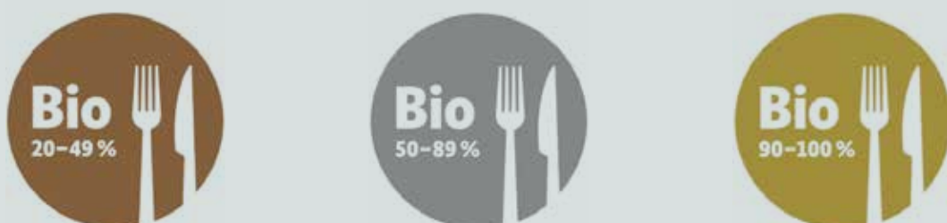
Abbildung 9: Bio-AHV-Logo

Der Einsatz von bioregionalen Produkten sowohl in der Gemeinschaftsverpflegung als auch in Hotels, Restaurants, Jugendherbergen etc. hat in Mecklenburg-Vorpommern als Tourismusland umfassende Marktpotentiale und soll damit befördert werden. Die AHV-Unternehmen sollen z.B. mit Beratung und finanziellen Zuschüssen bei den Zertifizierungskosten (Abstimmung hierzu u.a. mit den anderen Ländern, dem Bundesministerium für Ernährung, Landwirtschaft und Heimat sowie der Bundesanstalt für Landwirtschaft und Ernährung) bei der Umsetzung rechtlicher Vorgaben unterstützt werden. Auch mit der stärkeren Umsetzung praxisbezogener regionaler Wertschöpfungsketten in Mecklenburg-Vorpommern (vom Erzeuger bis zum Verbraucher) soll eine stärkere Einbindung regionaler ökologischer Erzeugnisse im Land erfolgen. Anstehende Vorhaben z.B. der Stadt Rostock ab 2025 regionale Bioprodukte in die Gemeinschaftsverpflegung mit aufzunehmen, sollen durch das Netzwerk „Bioregionale Wertschöpfung“ eng begleitet werden.