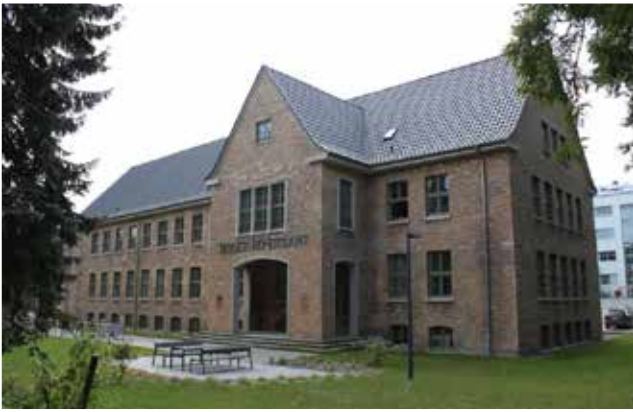
Abbildung 6: Hauptgebäude des Landesamtes in Rostock

Das Landesamt ist für eine Vielzahl von Sachverhalten im ökologischen Landbau zuständig, darunter insbesondere den Verbraucherschutz, die rechtskonforme Umsetzung der ökologischen Wirtschaftsweise sowie die Kontrolle. Das Vertrauen der Verbraucherinnen und Verbraucher in regionale Bioprodukte bildet eine essentielle Grundvoraussetzung für den nachhaltigen Absatz dieser Produkte und der daraus hergestellten Lebensmittel. Auch für die Erzeugerinnen und Erzeuger selbst sind gesicherte Qualität und Produktsicherheit von zentraler Relevanz.