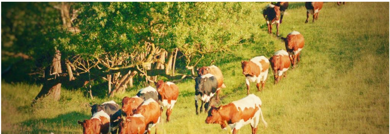
Abbildung 2: Nutztierhaltung im ökologischen Landbau

Auskunft erteilt das Landesamt für Landwirtschaft, Lebensmittelsicherheit und Fischerei Mecklenburg-Vorpommern.