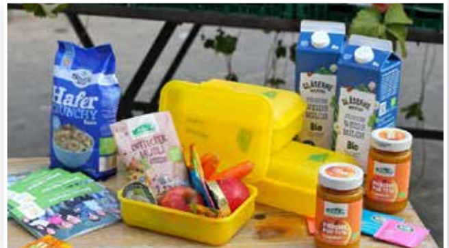
Abbildung 7: Bio-Brotbox

Der Erstplatzierte erhält ein Preisgeld in Höhe von 2.000 Euro. Die zweit- und drittplatzierten Teilnehmerinnen und Teilnehmer erhalten jeweils ein Preisgeld in Höhe von 1.000 Euro bzw. 500 Euro.