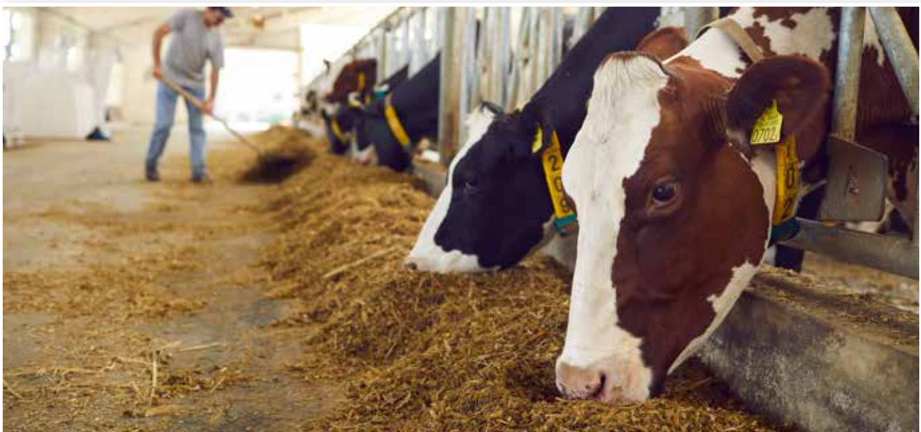
Abbildung 3: Rinderstall