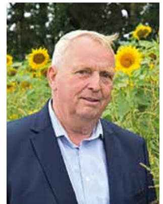
Dr. Till Backhaus

Ihr Dr. Till Backhaus Minister für Klimaschutz, Landwirtschaft, ländliche Räume und Umwelt des Landes Mecklenburg-Vorpommern