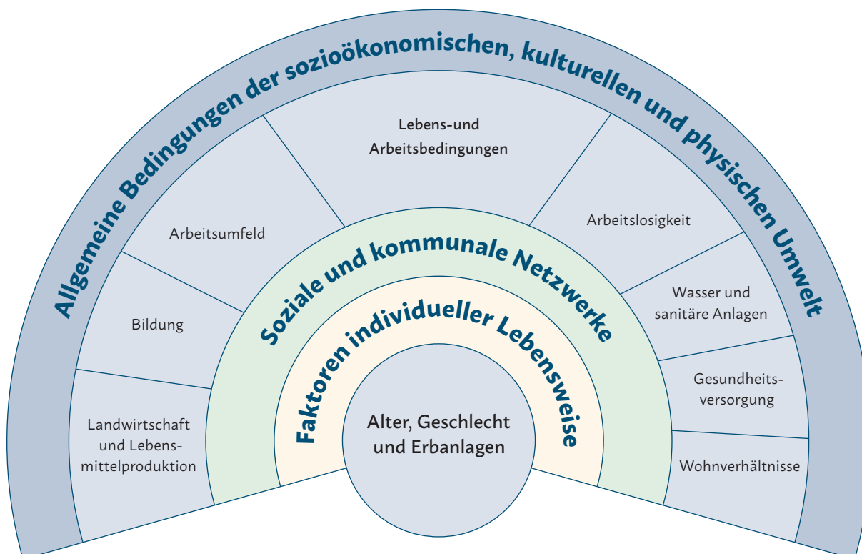
Abbildung 3: Determinanten der Gesundheit, aus: Leitbegriffe der Gesundheitsförderung und Prävention, Bundeszentrale für gesundheitliche Aufklärung (BZgA) nach Dahlgren & Whitehead 6

Eine wichtige thematische Schnittstelle auf Landesebene besteht zum Masterplan Gesundheitswirtschaft. Die Aktivitäten des Masterplans sind vorwiegend auf die Sekundär- und Tertiärprävention gerichtet; viele Akteure und Akteurinnen der Gesundheitswirtschaft leisten jedoch auch zu Gesundheitsförderung und Prävention wichtige Beiträge. Ansatzpunkte zur Kooperation gibt es hierzu in verschiedenen Handlungsfeldern der Landesstrategie.